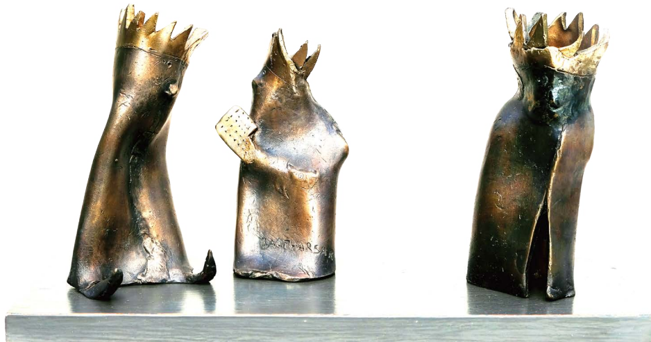
Melchior, Balthasar und Caspar, (Die Heiligen Drei Könige), 2019, Bronzen, Höhe 18 - 20 cm