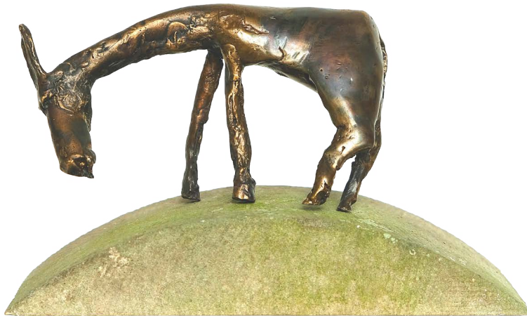
Nach der Flucht, 2019, Bronze, Höhe 12 cm